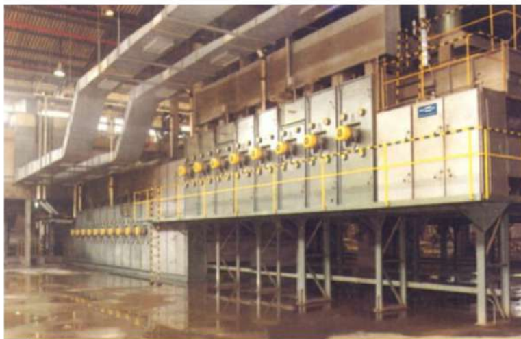
Secador contínuo com dois estágios para borracha sintética e resinas. Two decks continuous air dryer for synthetic rubber and resins.