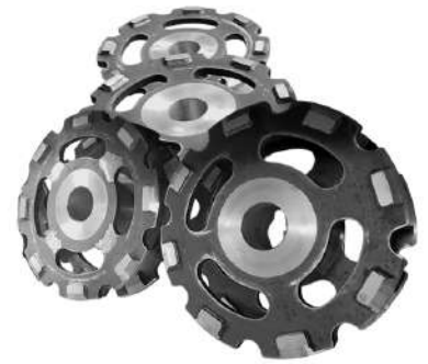
Diversos tipos de engrenagens. Various types of gears.