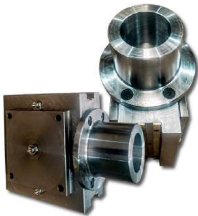
Diversos tipos de mancais. Different types of bearings.