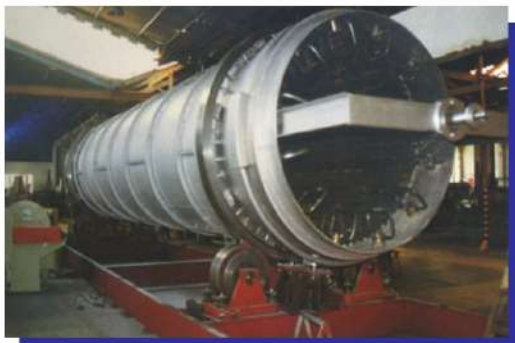
Secador rotativo para produtos siderúrgicos. Rotary dryer for metallurgical products.

This cylindrical body is supported by four support rollers and has a transmission means so that it rotates and transports the product internally. We manufacture this type of dryer completely according to the customer's needs. We develop it in the dimensions according to the required capacity, using materials such as carbon steel, stainless steel and integrating the entire control and operation system for this dryer.