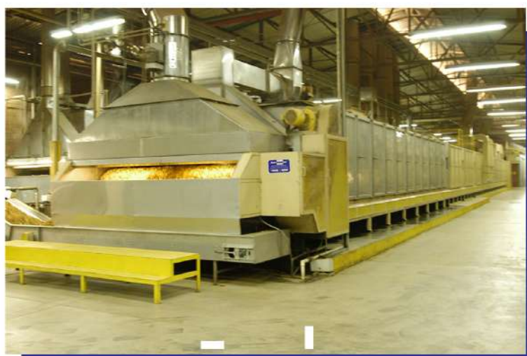
Secador de esteira para aplicações diversas. Conveyor dryer for various applications.