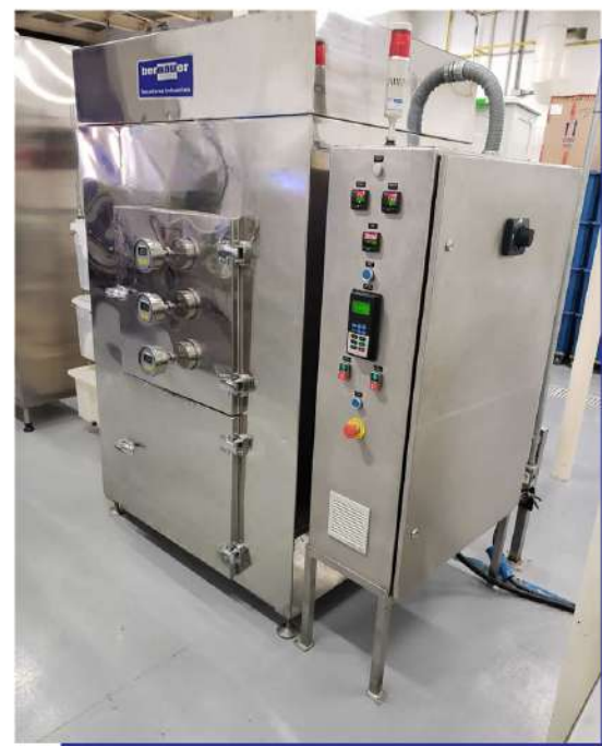
Estufa de secagem para diversos produtos. Drying oven for various products.