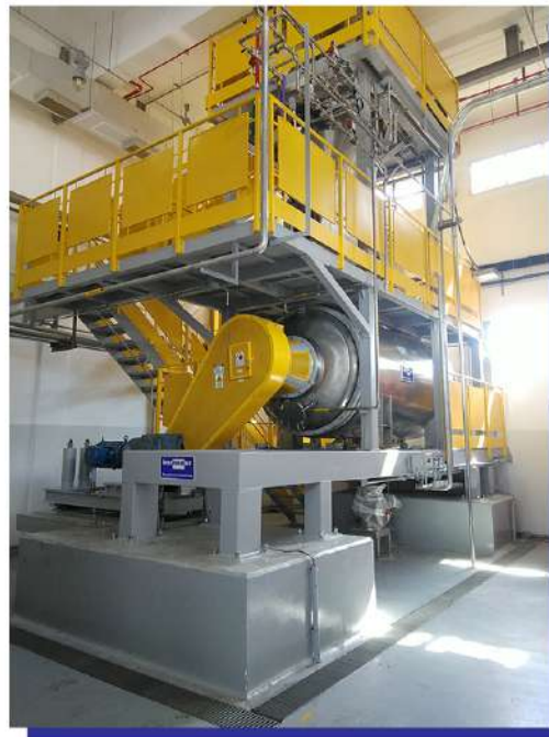
Secador rotativo a vácuo. Rotatory vacuum dryer.