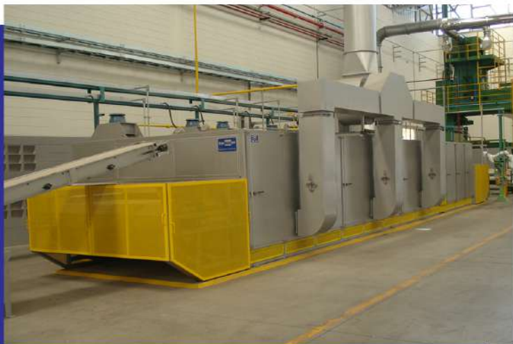
Secador contínuo de esteira para fibra de poliéster. Continuous conveyor dryer for polyester fiber.