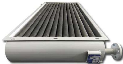
Trocador de calor. Heat exchange.