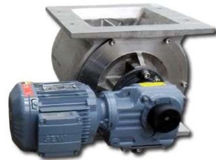
Válvula rotativa. Rotary valve.