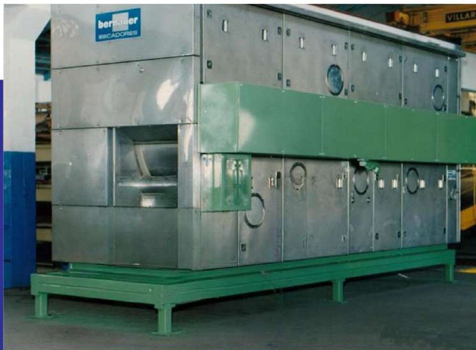
Secador de tambor para diversos tipos de fibras. Drum dryer for divers fibras.