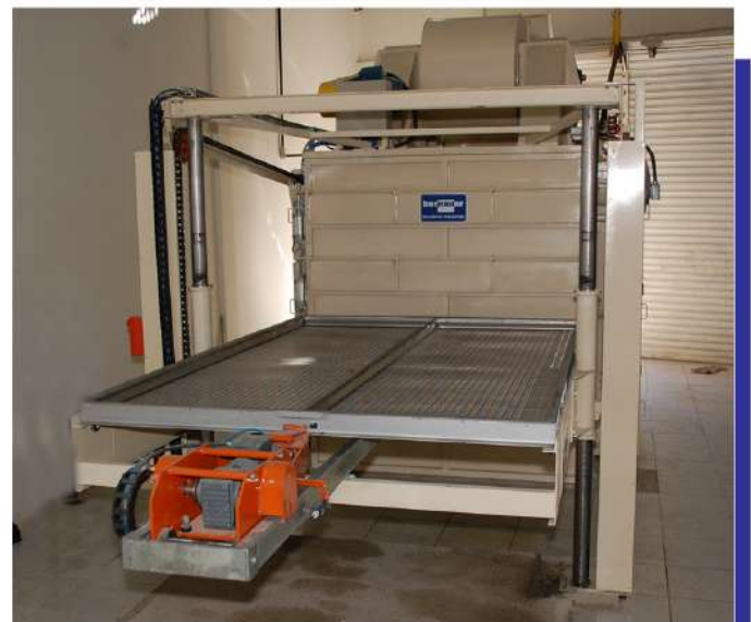
Desidratadora semi-contínua com bandeja para produtos vegetais. Semi-continuous dryer with tray for vegetables.