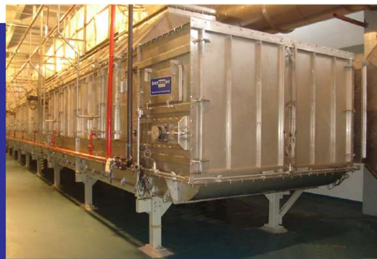
Secador de esteira para nibs cacau. Conveyor dryer for cocoa nibs.