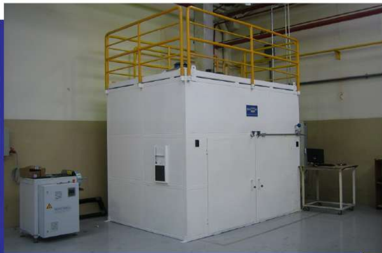
Estufa de cura para insumos industriais. Curing oven for industrial supplies.