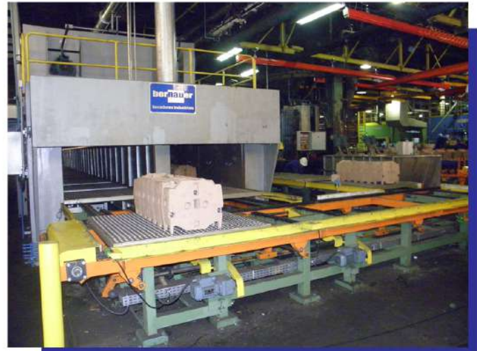
Secador tipo túnel para machos de areia para fundição (blocos de motores) Tunnel dryer for sand cores for casting (Engine blocks).