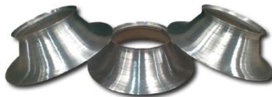
Cones repuxados. Drawn cones.