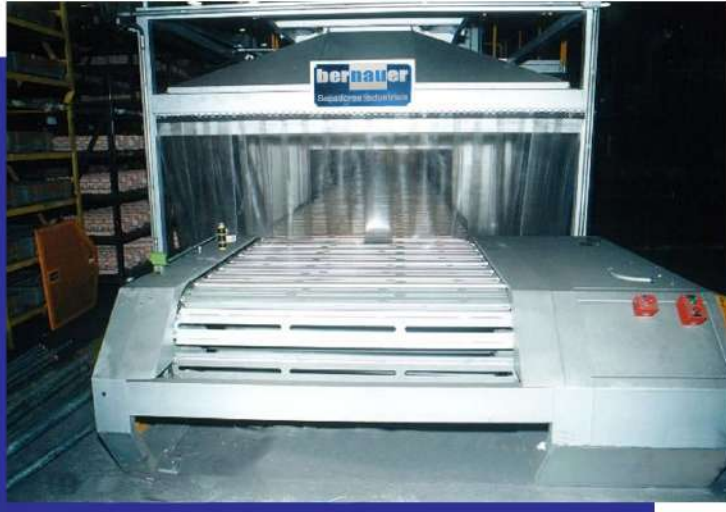
Secador de esteira tipo taliscas para machos de areia para fundição (peças diversas). Conveyor dryer for molds of sand to foundry (Several pieces).