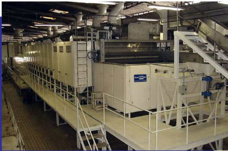
Secador contínuo de esteira de dois estágios para coco ralado. Two - stage continuous belt dryer for shredded coconut.