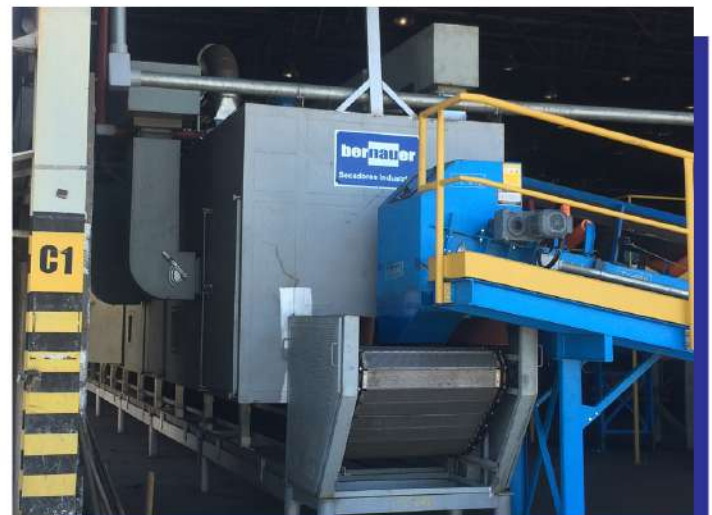
Secador de esteira para briquete. Belt dryer for briquettes.