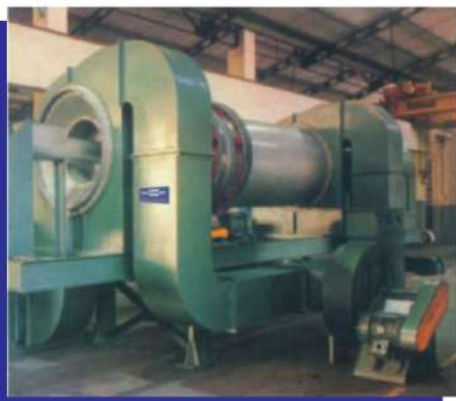
Secador resfriador rotativo com fendas de ar internas. Rotary cooler dryer with internal air slots.