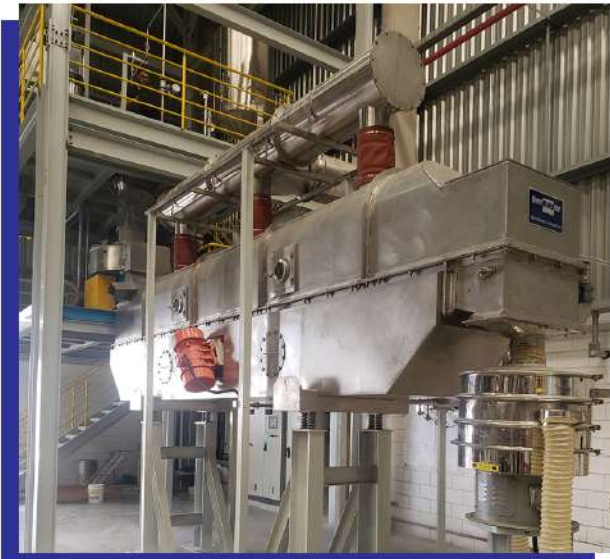
Resfriador contínuo por leito-fluidizado. Continuous fluidized bed cooler.