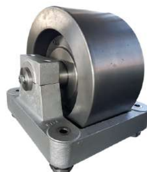
Rolo rotativo. Rotary roller.