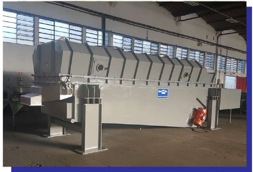
Secador contínuo por leito-fluidizado vibratório. Continuous dryer vibrating fluid-bed.