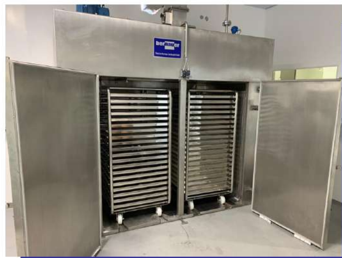
Estufa estacionária com carrinhos. Stationary greenhouse with trolleys.