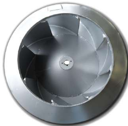
Rotores industriais. Industrial rotors.