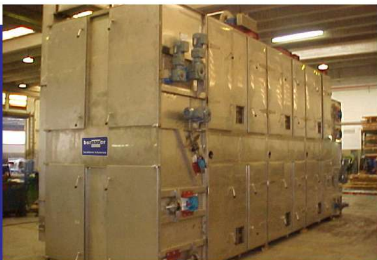
Secador para pigmento 2 estágios. Pigment dryer with 2 stage pigment.