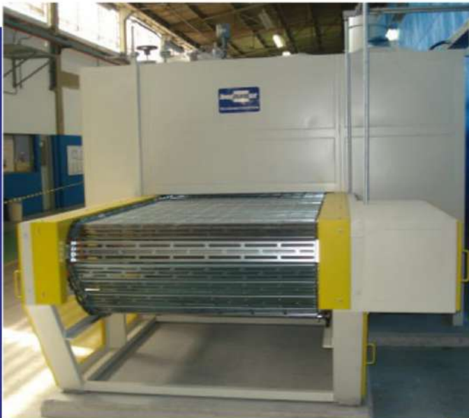
Secador de esteira para diversas aplicações. Belt dryer for various applications.