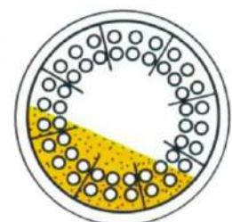
Secador tostador com tubos internos aquecidos para farelos. Toasting dryer with heated internal tubes for brans.