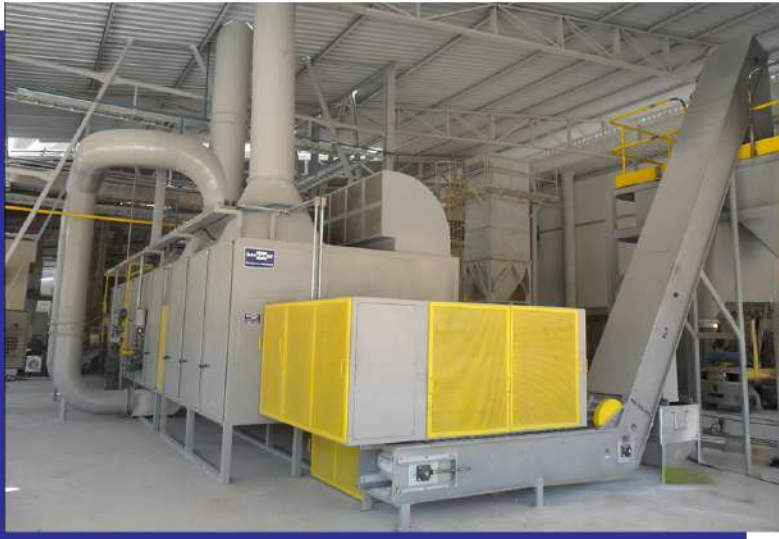
Secador contínuo de esteira para pellets de talco. Continuous belt dryer for talc pellets.