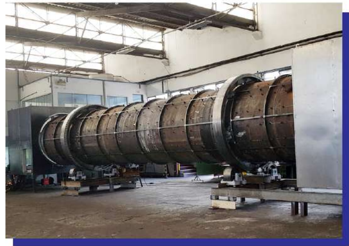
Secador rotativo. Rotary dryer.

Este corpo cilíndrico é apoiado sobre quatro rolos de apoio e conta com um meio de transmissão para que ele gire e transporte o produto internamente. Fabricamos este tipo de secador completamente conforme a necessidade do cliente. Desenvolvemos nas dimensões conforme a capacidade exigida, utilizando materiais como aço carbono, aço inox e integrando todo o sistema de controle e operação para este secador.