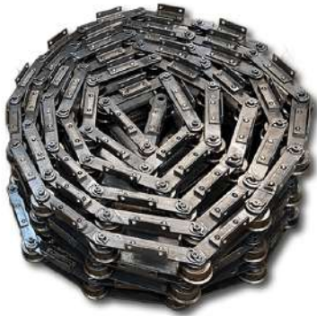
Correntes industriais. Industrial currentes.