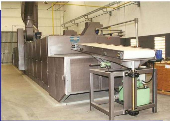
Secador de esteira para diversas aplicações. Belt dryer for various applications.