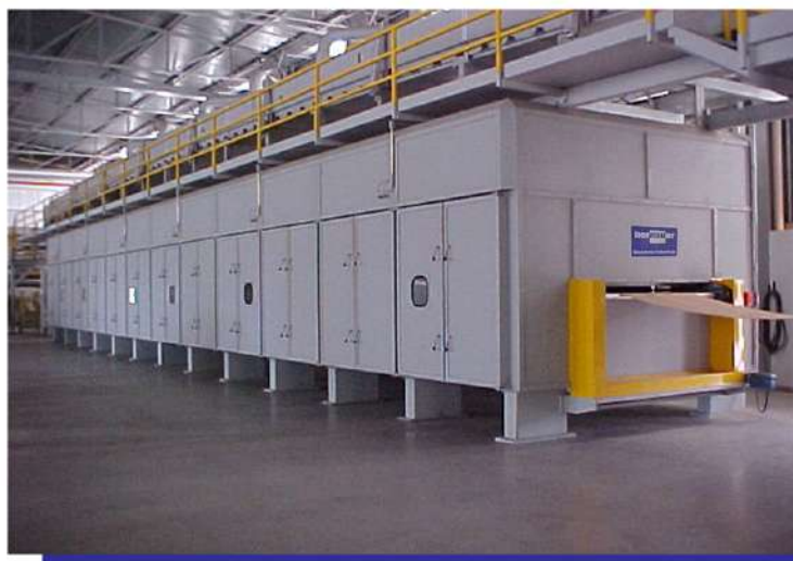
Secador para papel impregnado. Dryer for impregnated paper.