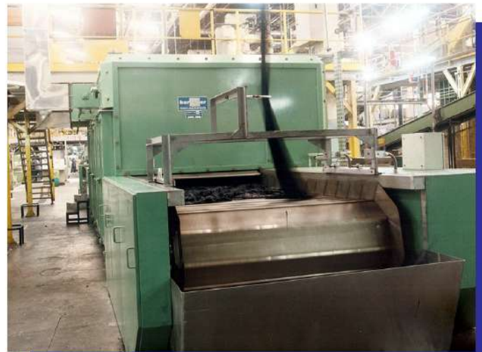
Secador contínuo de esteira para fibra de poliéster. Continuous conveyor dryer for polyester fiber.