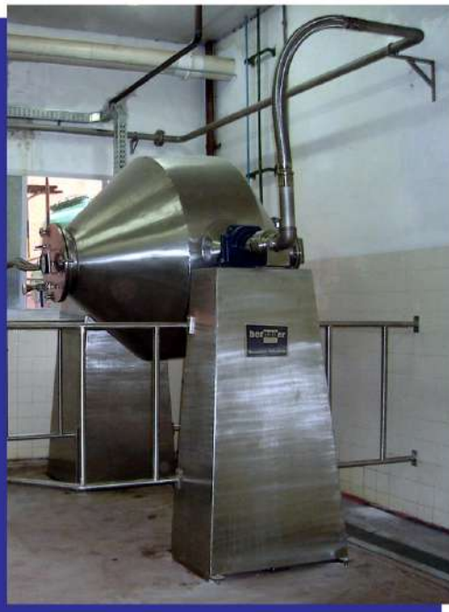
Secador rotativo a vácuo tipo "duplo cone". "Double cone" rotatory vacuum dryer.