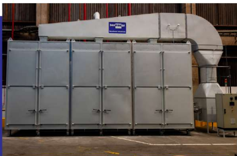
Estufa de secagem para aquecimento de tambores. Drying oven for plastic inputs.