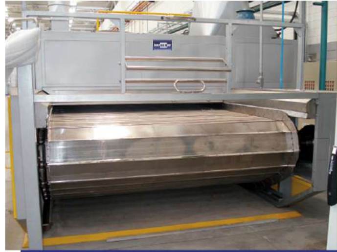
Secador de esteira para diversas aplicações. Belt dryer for various applications.