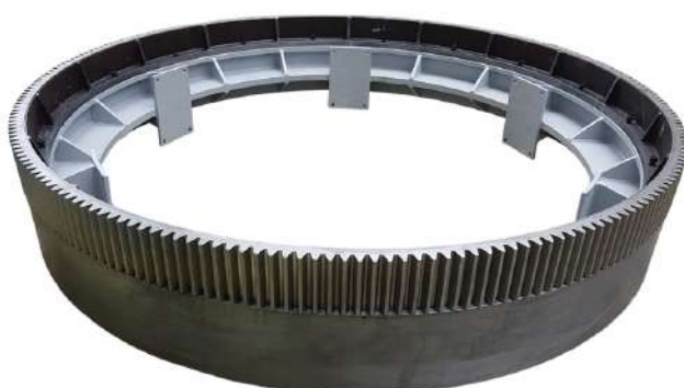
Anel rotativo. Rotating ring.

Trolleys and trays in carbon steel and stainless steel.