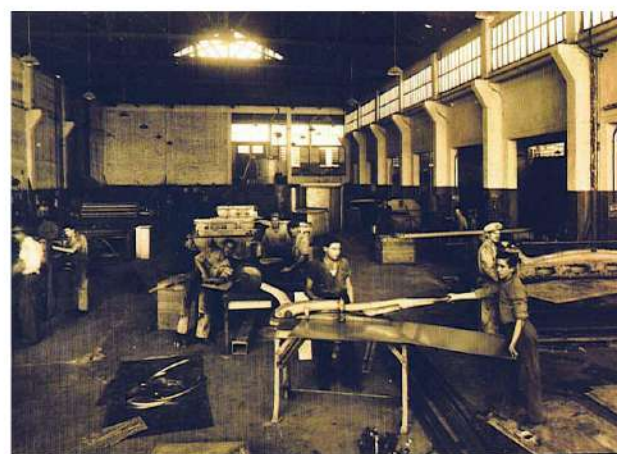
Bernaer secadores industriais, 1946

E peças de reposição diversas. And various spare parts.