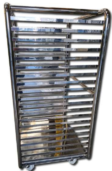
Carrinhos e bandejas em aço carbono e aço inox.

Trolleys and trays in carbon steel and stainless steel.