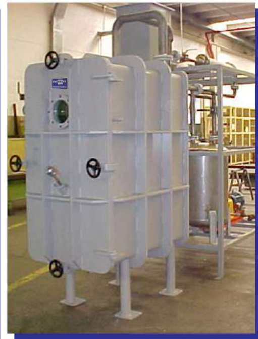
Secador estacionário a vácuo com prateleiras aquecidas. Vacuum stationary dryer with heated shelves.