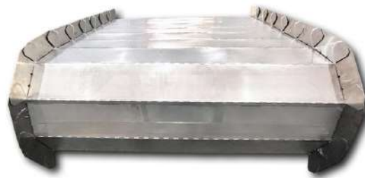
Diversos tipos de esteiras. Different types of conveyor belts.